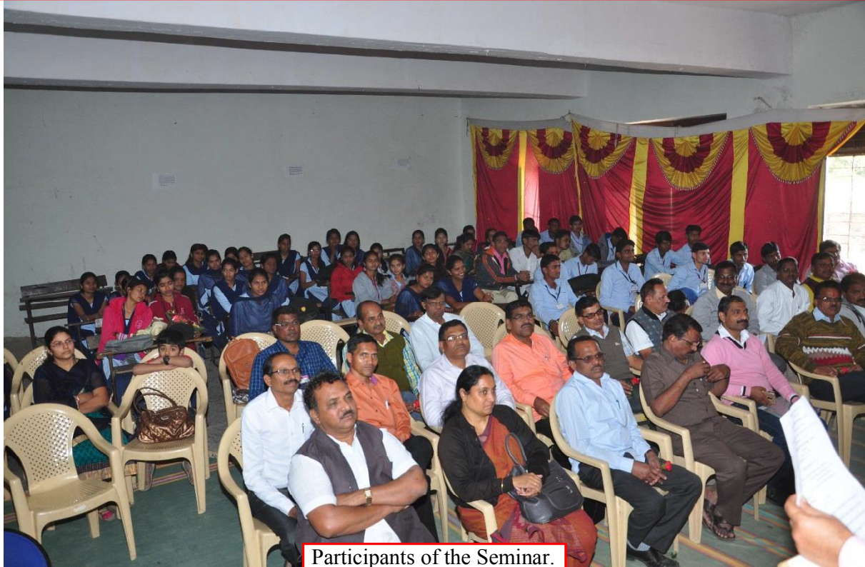
Participants of the Seminar.