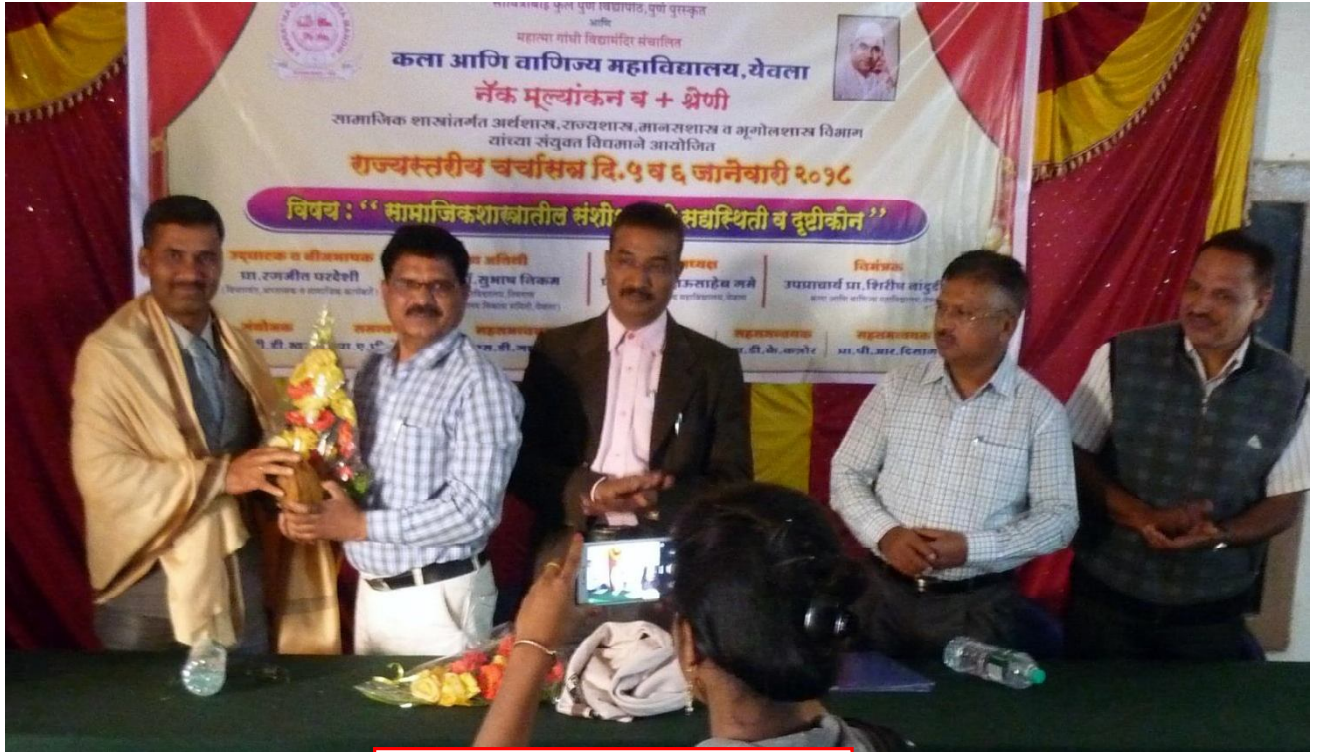
Felicitation ceremony in the Seminar.