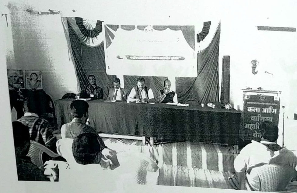
प्रा. डॉ. पुनः पुनः गाडे फेंवटी महाविद्यालय नाशिक चर्चासभेत साधक व्याक्ती म्हणून मार्गदर्शन करतांना