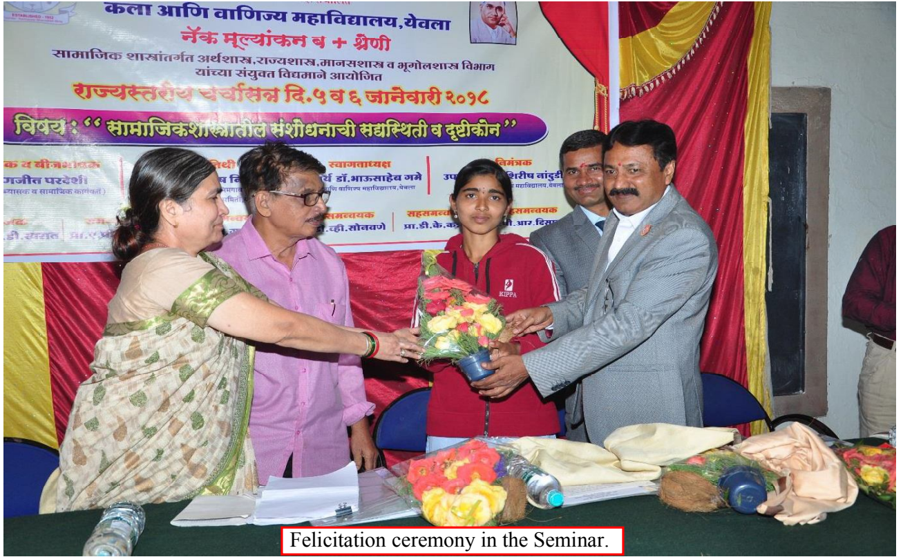
Felicitation ceremony in the Seminar.